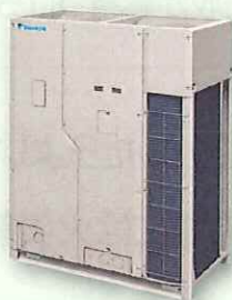
ビル用マルチエアコン