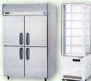
業務用冷凍冷蔵庫