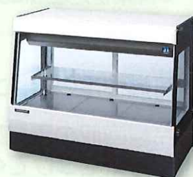
冷凍冷蔵用ショーケース など